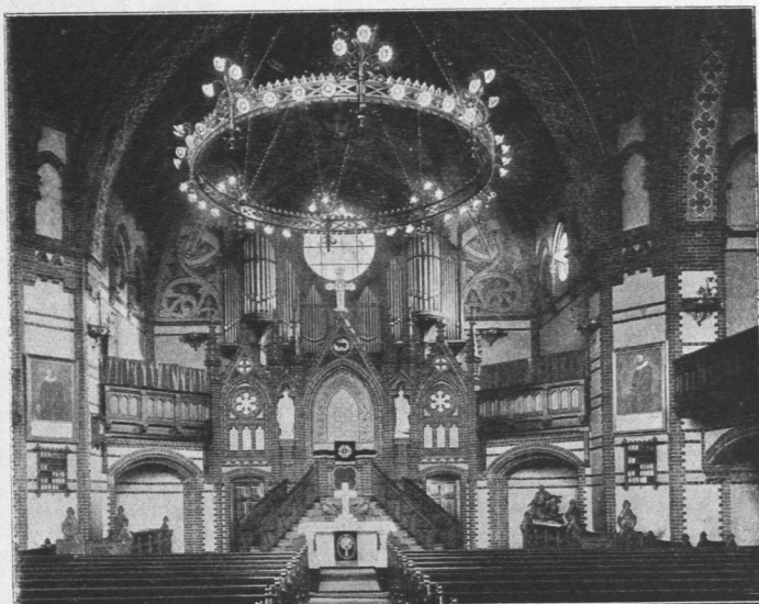
Abb. 95. St.-Annen-Kirche, Hammerbrook, Innenansicht.

In weiterer Ausbildung der gleichen Innenanordnung für Altar und Orgel wurde 1898 bis 1901 von dem Architekten Lorenzen, B. D. U., die St.-Annen-Kirche (Abb. 94 bis 96) im Hammerbrook erbaut. Der 15 m weite Mittelraum ist mit einer in sichtbarer Holzbaumeise hergestellten Kuppel überdeckt, deren Verankerung zum Teil durch das Gestänge des mit einem etwa 8 m großen Ring ausgebildeten Kronleuchters aufgenommen wird. Im unteren Raum der Kirche befinden sich 553, auf den Emporen 292 und auf dem Orgelchor 35 Plätze, so daß die Kirche im ganzen 880 feste Sitzplätze enthält. Die Kirche steht jederseits mit einem Pastorat und einem Konfirmandensaal in Verbindung. Die bebaute Fläche der Kirche umfaßt 650 qm, die der Pastorate und Säle zusammen 500 qm. Die Gesamtbaukosten haben 400000 Mark betragen, wovon 215000 Mark auf die Kirche selbst entfallen.