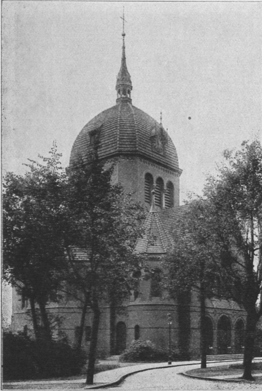
Abb. 92. Erlöserkirche in Borgfelde, Ansicht.