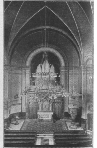
Abb. 87. Apostelkirche in Eimsbüttel, Innenansicht.

Nachdem die Kirche 15 Jahre stand, hatte sich die Einwohnerzahl Eimsbüttels so erheblich vermehrt, daß nochmals eine Teilung vorgenommen werden mußte. 1912 wurde das nördliche Gebiet abgetrennt und hier von den Architekten Distel, B. D. A., und Grubitz, B. D. A., die Stephans-Kirche (Abb. 89 bis 91)