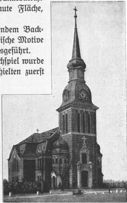
Abb. 84. Matthäus-Kirche in Winterhude, Ansicht.

Als zweite wurde 1899 vom Architekten Groothoff, B. D. A., die Markus-Kirche (Abb. 82 und 83) in Hoheluft, gleichfalls mit Holzdecke und mit Emporen, die auf Holzpfosten ruhen, erbaut (610 Plätze, 445 qm bebaute Fläche, Baukosten einschließlich der Heizanlage und der gesamten Einrichtung 106500 Mark).