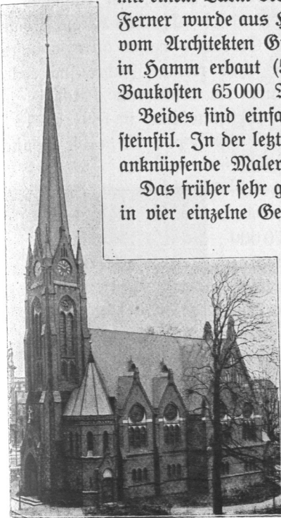
Abb. 82. Markus-Kirche in Hoheluft, Ansicht.

1893 die Lukas-Kirche in Fuhsbüttel (Abb. 80 und 81) vom Architekten Faulwasser. Sie hat eine Holzdecke mit innen sichtbarer Dachkonstruktion sowie eine nur auf der Südseite herumgeführte Empore. Der Altar und die Kanzel sind aus Verblendziegeln gemauert (320 Plätze, 214 qm bebaute Fläche, Baukosten 65000 Mark).