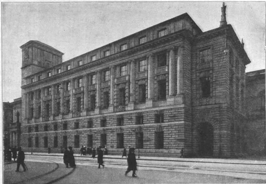
Abb. 72. Börse, von der Großen Johannisstraße.

Entwurf: Bauinspektor Dr.-Ing. Erbe. Ausführung: Baurat Janssen und Baumeister Glückstadt.