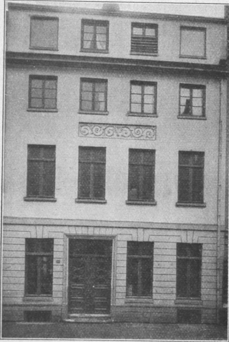
Abb. 48. Katharinenstraße Nr. 22. Aus: Erbe und Ranck, Das Hamburger Bürgerhaus.