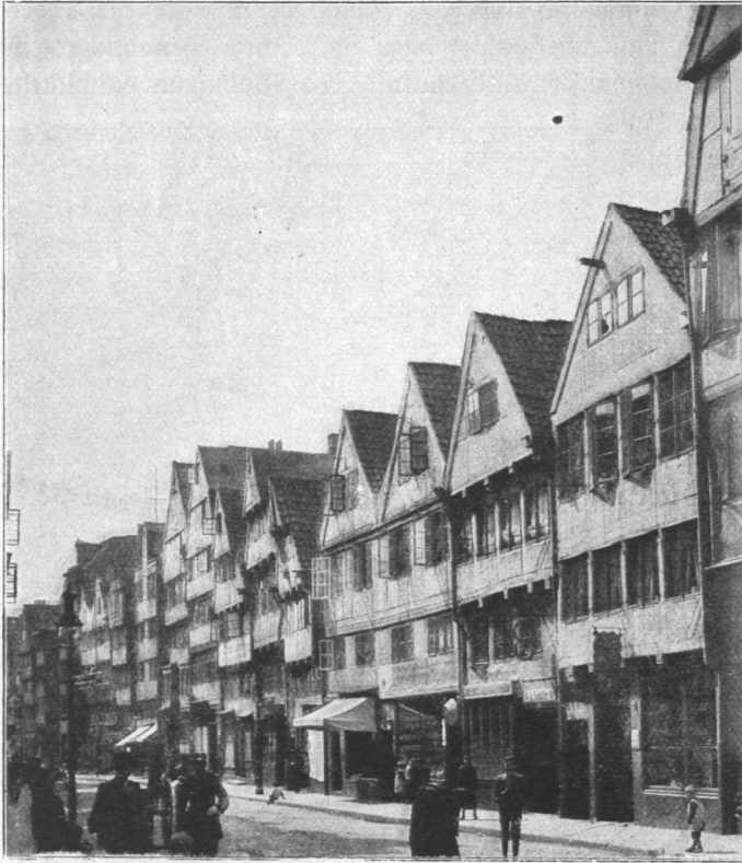
Abb. 25. Nordseite der Spitalerstraße.