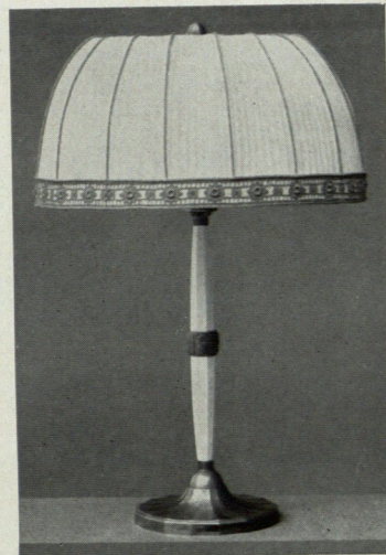
LAMPEN IN SILBER, KERAMIK U. BRONZE.