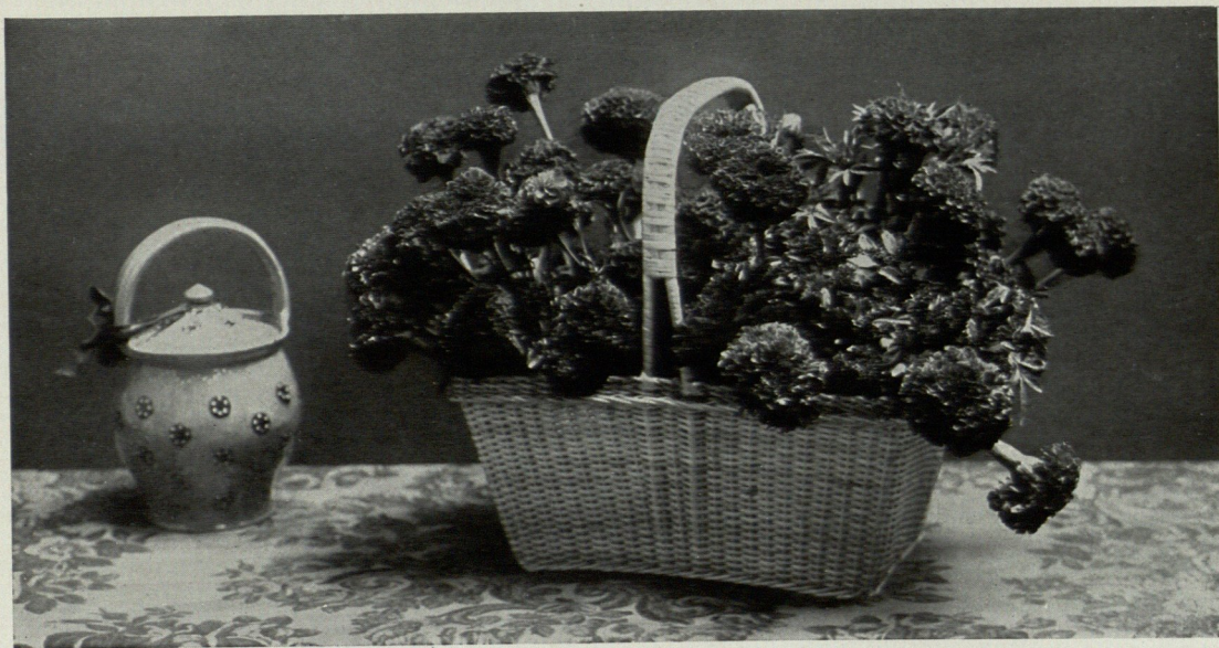
FRANZISKA BRUCK—BERLIN. BLUMENDEKORATION, KÖRBCHEN MIT STUDENTENBLUMEN.