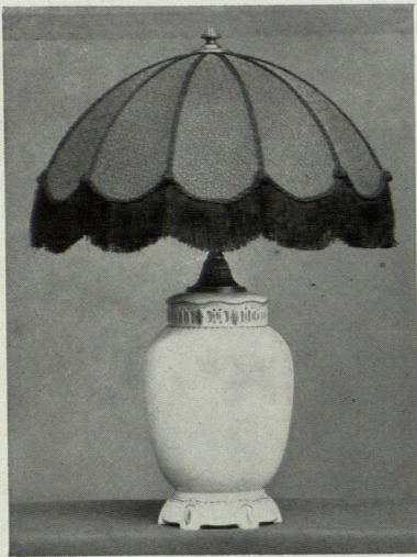
WERKSTÄTTEN: G. KRÜGER—BERLIN.