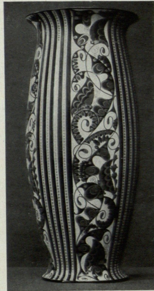
E. WAHLISS. WIENER SERAPIS-FAYENCE.