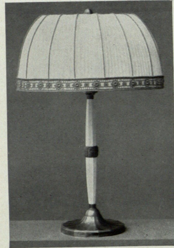
LAMPEN IN SILBER, KERAMIK U. BRONZE.