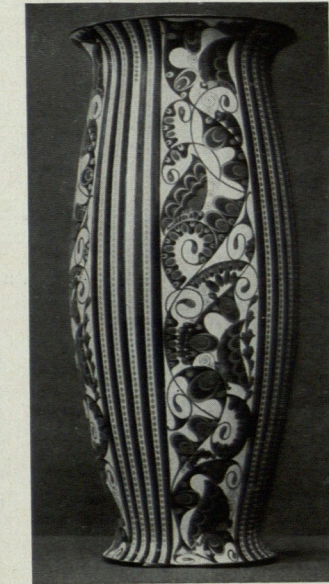
E. WAHLISS. WIENER SERAPIS-FAYENCE.