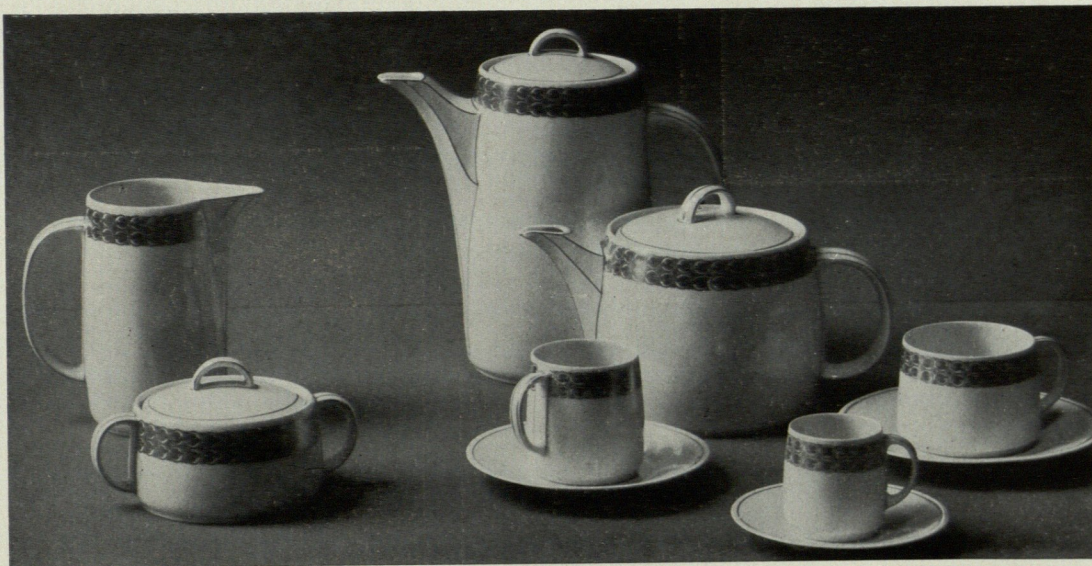
PORZELLANFABRIK WEIDEN, GEBR. BAUSCHER A.-G.