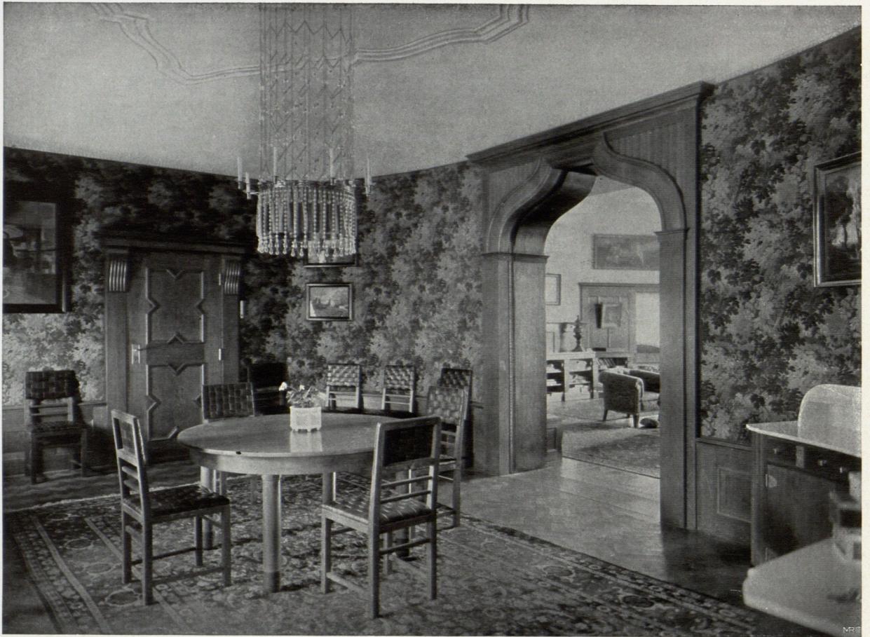
PROF. EMANUEL VON SEIDL—MÜNCHEN.