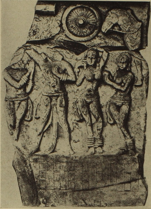
225. Relieffragment aus Amarāvati