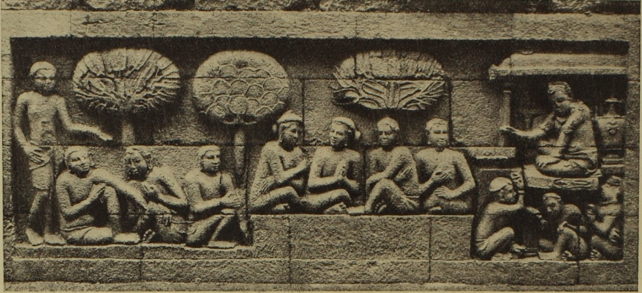
190. Relief vom Borobudur. 1. (zugeschüttete) Terrasse. (Nach With)

Würdigung dieser Kunst verbietet uns hier der zugemessene Raum. Es sei daher auf die reich illustrierte ausgezeichnete Darstellung der Plastik von K. With in seinem Java verwiesen. In der Reliefplastik von Borobudur fand die buddhistische Plastik der Guptaperiode außerhalb Indiens ihre Fortsetzung. Über den verbindenden Weg von der einen zur anderen auch zeitlich lang getrennten Schule wissen wir freilich noch nichts. Der formale Zusammenhang mit der Gupta-Plastik zeigt sich mehr in der Körpergestaltung, dem Ausrunden der Glieder u. dgl. als in der Komposition. Diese steht mit ihrer rhythmischen Anordnung einzig da (Abb. 190) und scheint ihre Wurzel in zugrundegegangenen Malereien zu haben. Die S. 134 erwähnten modernen