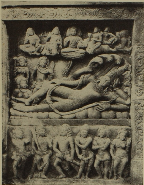
149. Vishnu auf der Schlange Ananta ruhend. (Tempel zu Deogurh)