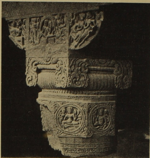
113. Kapitäl aus Adichantâ 7. Jh.