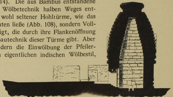
108. Schnitt des Yudhischthira-Tempels, Mahendragiri (Nach A. R. Madras 1916)

Auf die Raumeindeckung übertragen, wurde nun das indische Vorkragungs- und Überkrugungssystem von grundlegender gestaltbildender Bedeutung. Für wirkliche Hohlkuppeln ergab sich dadurch die hohe Spitzform. Hohlkuppeln spielten jedoch im indischen Tempelbau keine Rolle und kommen auch nur an buddhistischen Gandhârabauten vor (vgl. Foucher, L'art gréco-bouddhique du Gandâra I, 114). Die aus Bambus entstandene Shikharafornie kam der indischen Wölbetechnik halben Weges entgegen. Die Shikharas sind jedoch wohl seltener Hohltürme, wie das hier wiedergegebene Schema vermuten ließe (Abb. 108), sondern Vollbauten, wie die Ruine Abb. 109 zeigt, die durch ihre Flankenöffnung einen lehrreichen Einblick in die Bautechnik dieser Türme gibt. Aber nicht solche Turmwölbungen, sondern die Einwölbung der Pfeilerhallen, der Mandapas zeitigte den eigentlichen indischen Wölbstil, wenn man ihn so nennen darf. Die ältesten indischen „Horizontalkuppeln“ finden wir in den Dschainabauten Westindiens, in Mount Abu, Palitana und Girnâr (vgl. S. 74f.) vom 11. Jahrh. an. Das Prinzip dieses Eindeckungs-