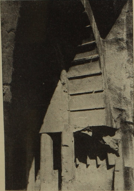
40. Eingang in Tschaitya X in Adschantā