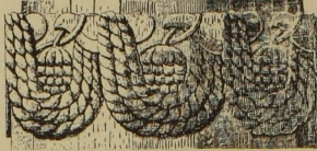
5. Girlande der Garudasäule in Besnagar