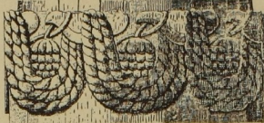
5. Girlande der Garudasäule in Besnagar