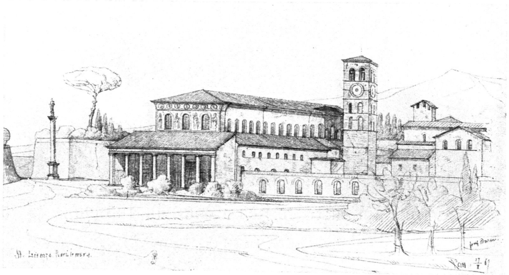
Kirche San Lorenzo fuori le mura zu Rom.

»Wiederbelebung« der Bauformen des alten Rom wurden in der ewigen Stadt selbst und in Toskana gemacht.