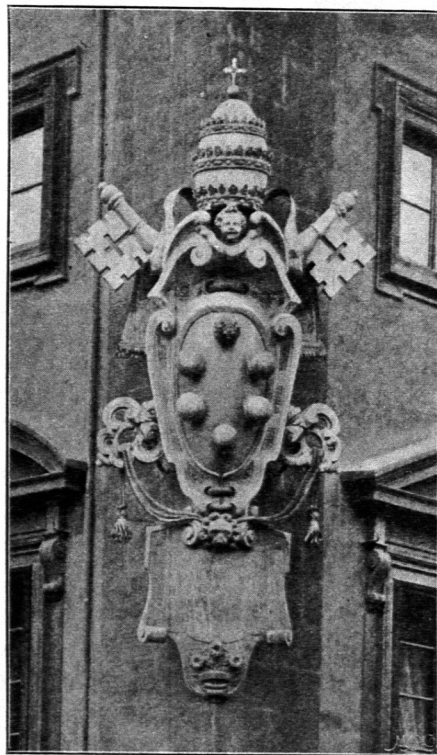
Vom erzbischöflichen Palast zu Florenz.