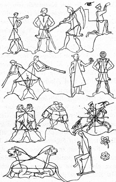
Hilfslinien zum Figurenzeichnen.