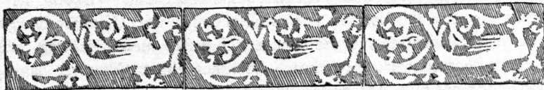
Fliesenborde aus Frankreich.