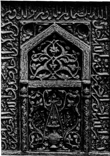
Verkleidung einer Gebetnische durch Lüsterplatten aus Persien 85) . (XIV. Jahrh. nach Chr.)