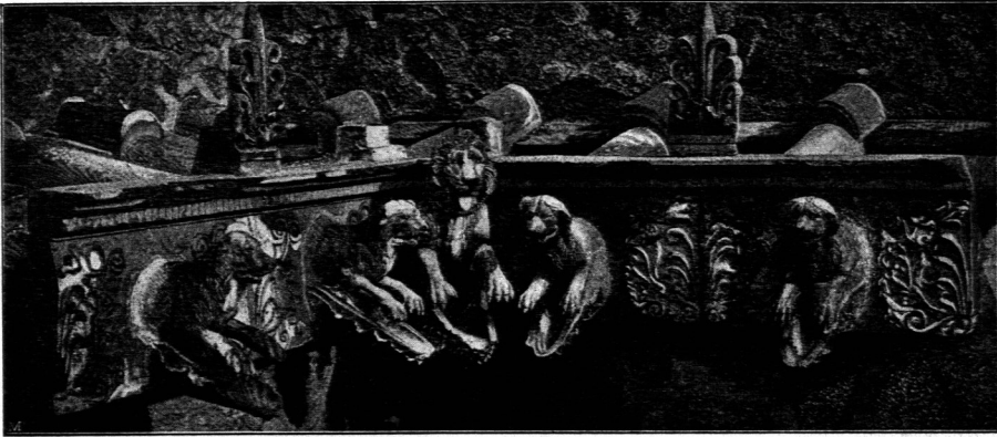
Traufkranz von Terracotta aus Pompei 48) .

in der Gliederfolge durchaus den für jene Zeit so charakteristischen Stuckgesimfen der Pompejanischen Wanddecorationen des frühen Stils. Als die Quelle dieses ersten Decorationsstils betrachtet man neuerdings Alexandrien in Aegypten, den eigentlichen schöpferischen Mittelpunkt der spät-griechischen oder hellenistischen Kunst, dessen Einfluss auf die Griechenstädte Italiens nachzuweisen ist.