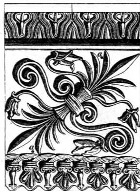
Verkleidungsplatte aus Terracotta vom Tempel zu Alatri 44) .