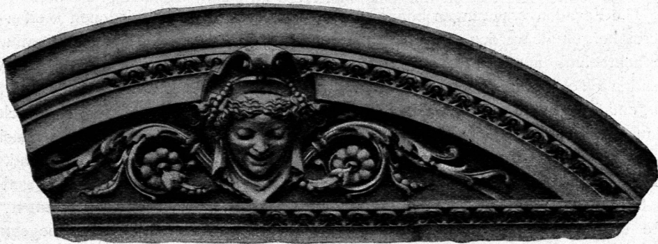
Fensterbekrönung vom neuen Louvre zu Paris 137) .