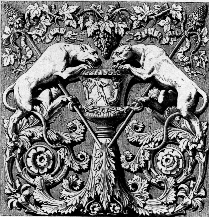
Füllungsornament, entworfen von F. Schinkel 136 ).