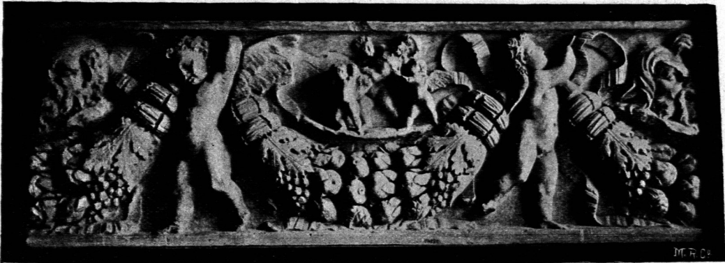
Antike Friesverzierung im Museum zu Neapel.