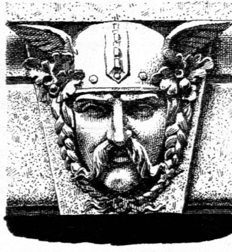
Schlufssteine mit vorgeetzten Masken 67) .