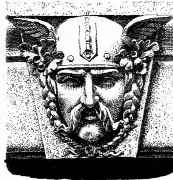
Schlufssteine mit vorgeetzten Masken 67) .