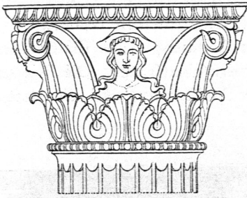
Korinthisches Kapitell aus Pästum 47) .

4 Paaren vereinigen, welche, zu Spiralen aufgerollt, die Ecken der Deckplatte stützen. Die vier zwischenliegenden Kelchflächen werden gewöhnlich von Palmettenzierden ausgefüllt. Auch finden sich zuweilen an dieser Stelle Büsten oder kleine Figuren angebracht (Fig. 85 47) ). An späteren Formen entwickeln sich aus 8 Stengeln, die aus den Zwischenweiten der hinteren Blattreihe emporwachsen, je zwei Ranken, die sich oben wieder paarweise vereinigen und in größeren Spiralen die Ecken der Deckplatte stützen, in kleineren die zwischenliegenden Flächen des Kelches schmücken (Fig. 86 48) ).