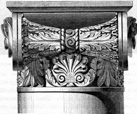
Vorder- und Seitenansicht eines römifch-jonifchen Säulenkapitells 43) .

Der Kranz von Eiformen und die ihn begleitende Perlenchnur dürften aus einem metallenen Reifen, der oben um den hölzernen Schaft der Säule gelegt wurde, hervorgegangen fein. Wenigstens läßt die alte Metalltechnik des Orients, namentlich Phöniziens, in welcher vorzugsweise das Treiben von Blechen und das Graviren derselben gebräuchlich waren, einen solchen Ursprung vermuthen. Erwähnt sei hier der Kapitellschmuck der Säulen vor dem Salomonifchen Tempel, die befondere Prachtstücke folcher Metalltechnik gewesen zu fein fcheinen.