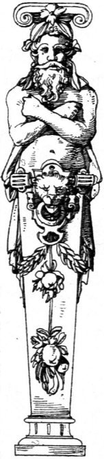
Hermenartige Karyatiden 38) . Deutsche Renaissance.