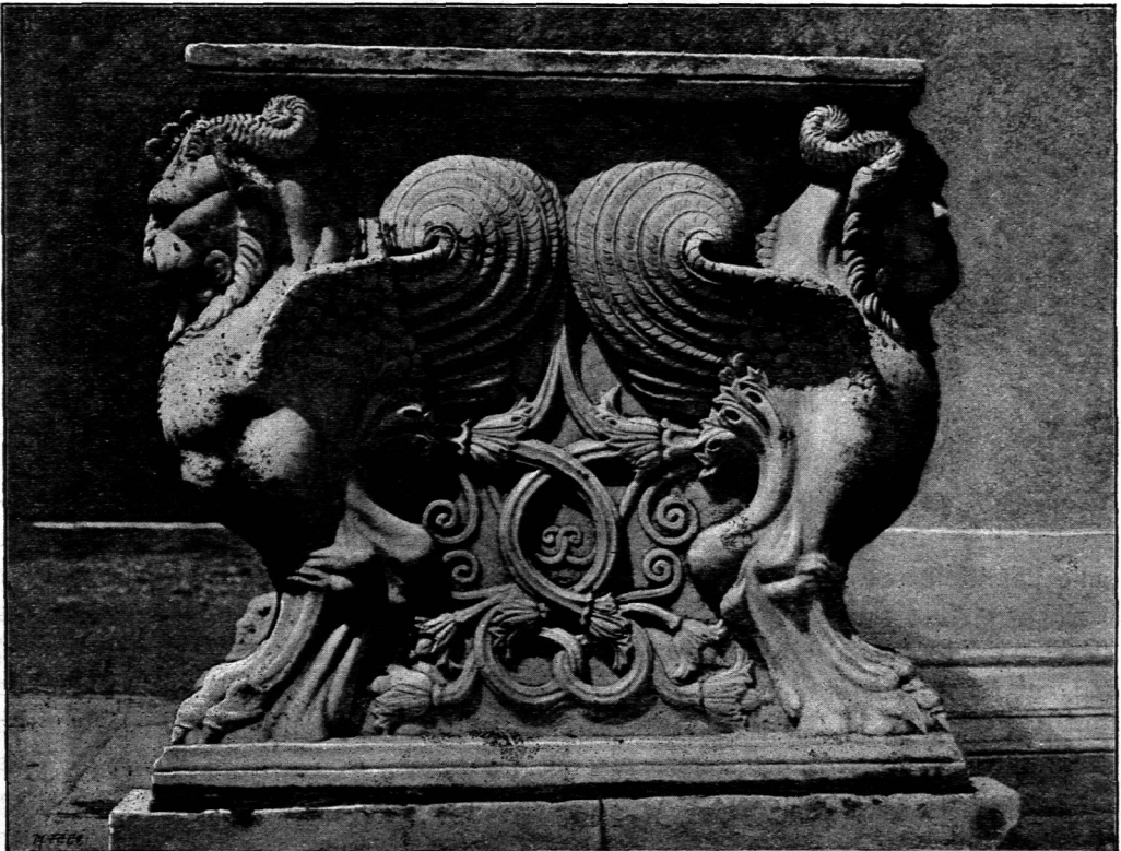
Außere Anficht eines Trägers von dem in Fig. 30 dargestellten Tische.