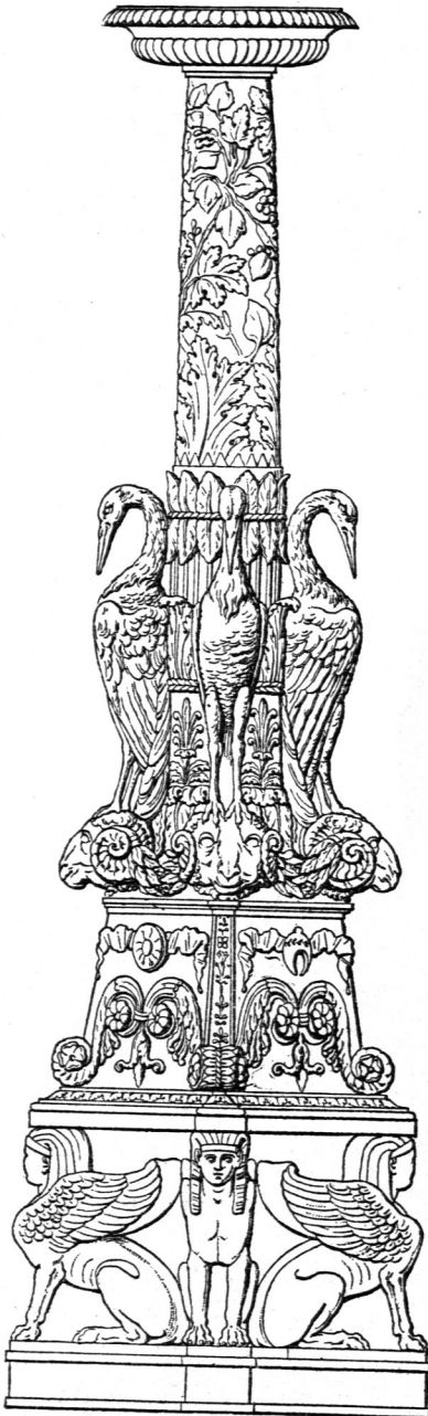
Marmor-Candelaber im Museum zu Neapel 18) .