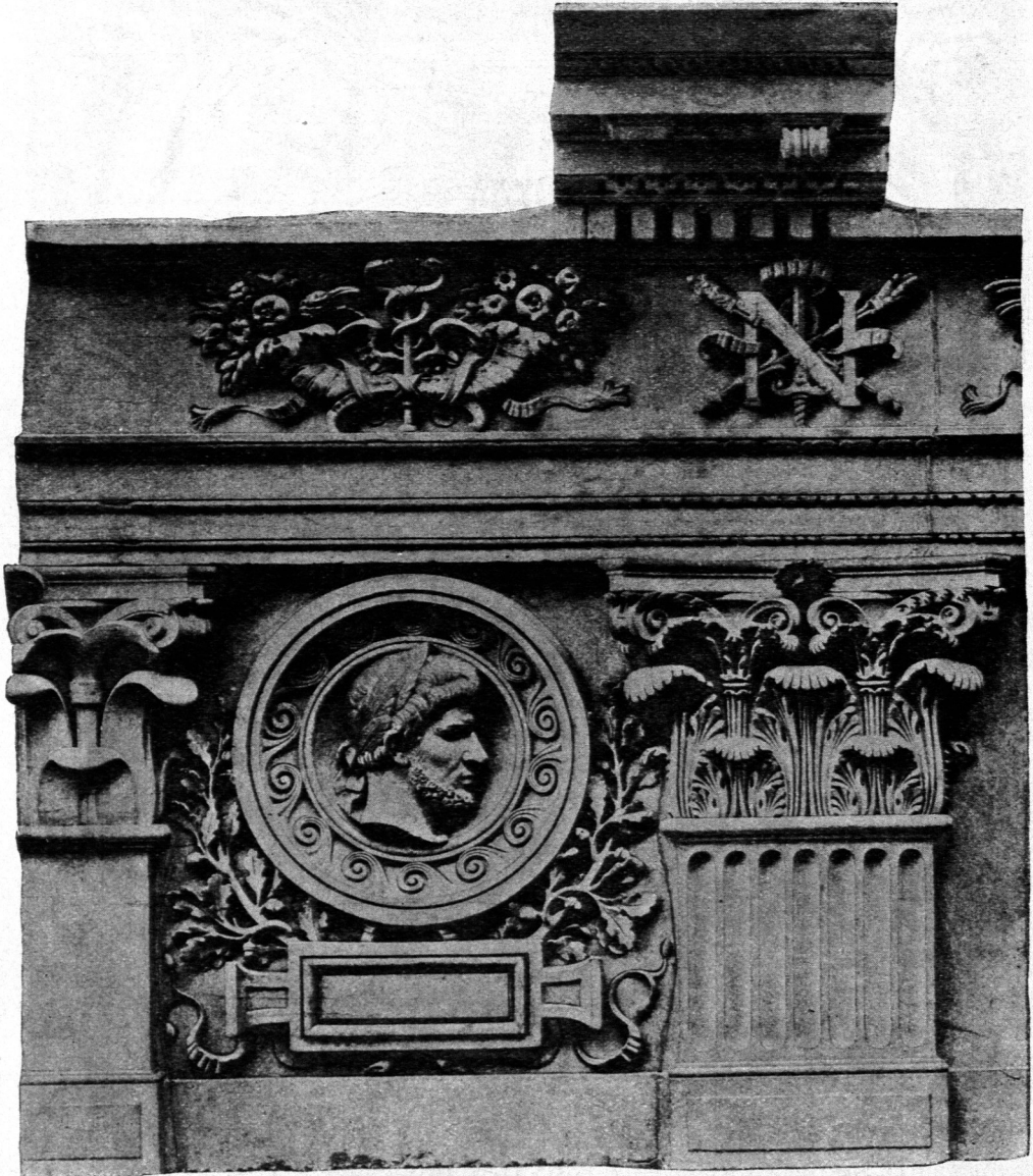
Partie vom neuen Louvre zu Paris 137) .