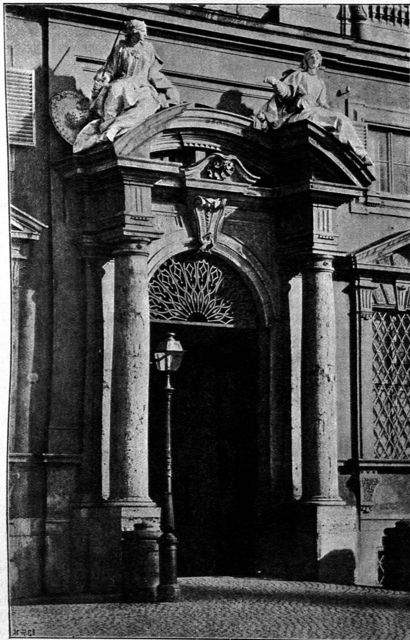
Portal des Palastes della Consulta auf dem Quirinal zu Rom.

dreieckes erheben sich auf den Ecken die abgebrochenen Enden eines Giebels oder volutenartige Decorationsstücke, während die Mitte durch eine reich geschmückte Tafel oder ein Wappen ausgefüllt wird. Die seitlichen Verkröpfungen bedingen