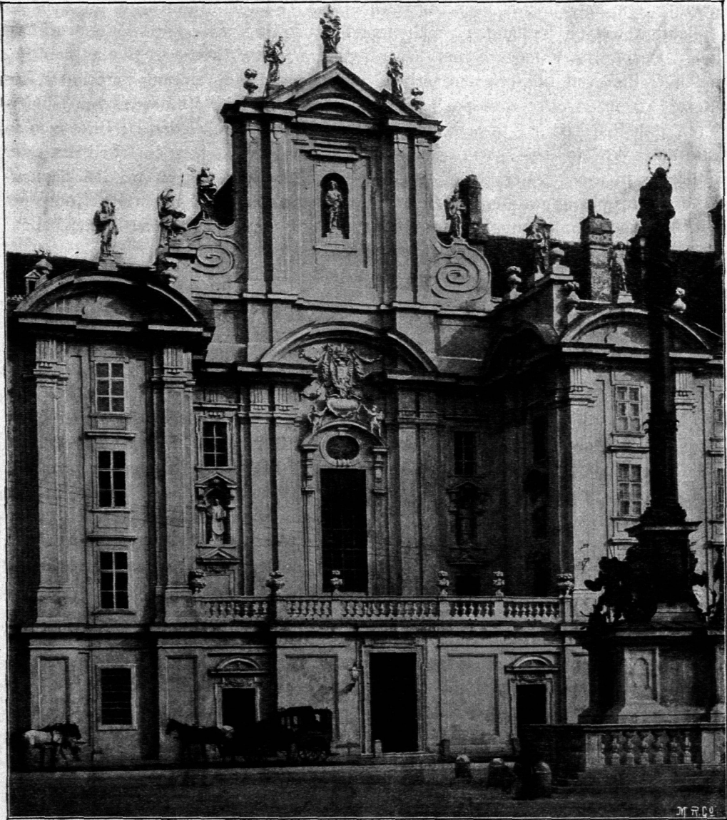
Façade der Pfarrkirche »Am Hof« in Wien.

gehängen u. f. w. geschmückt. Oder es erhalten die eingebogenen Formen an beiden Enden nach oben gerollte kleine Voluten, so daß sie in dieser Gestalt ebenfalls eine innere Spannung bekunden und damit der Wirkung des Strebepfeilers einen sichtbaren Ausdruck verleihen.