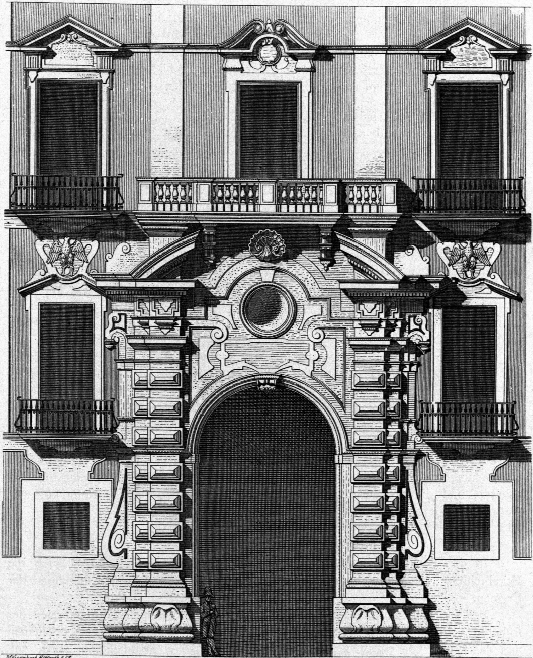
Portal eines Palastes zu Neapel 145) .

der einzelnen Theile wird es nothwendig, Formen zu erfinden, die, an sich bedeutungslos, ihren Sinn und Zweck nur in der Ausgestaltung der ganzen Composition