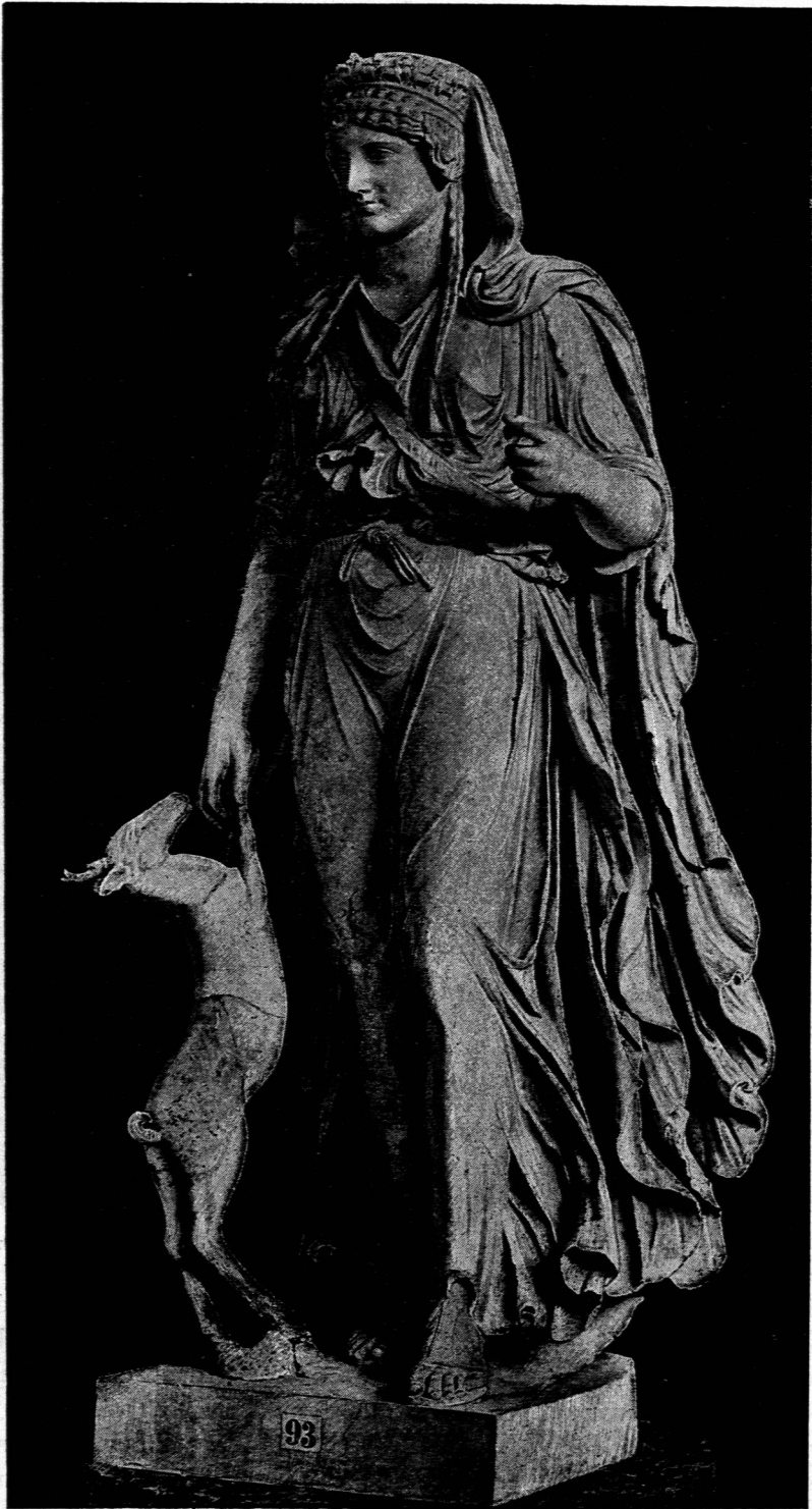
Statue der Artemis in der Glyptothek zu München; gefunden 1792 in Gabii 25 ).