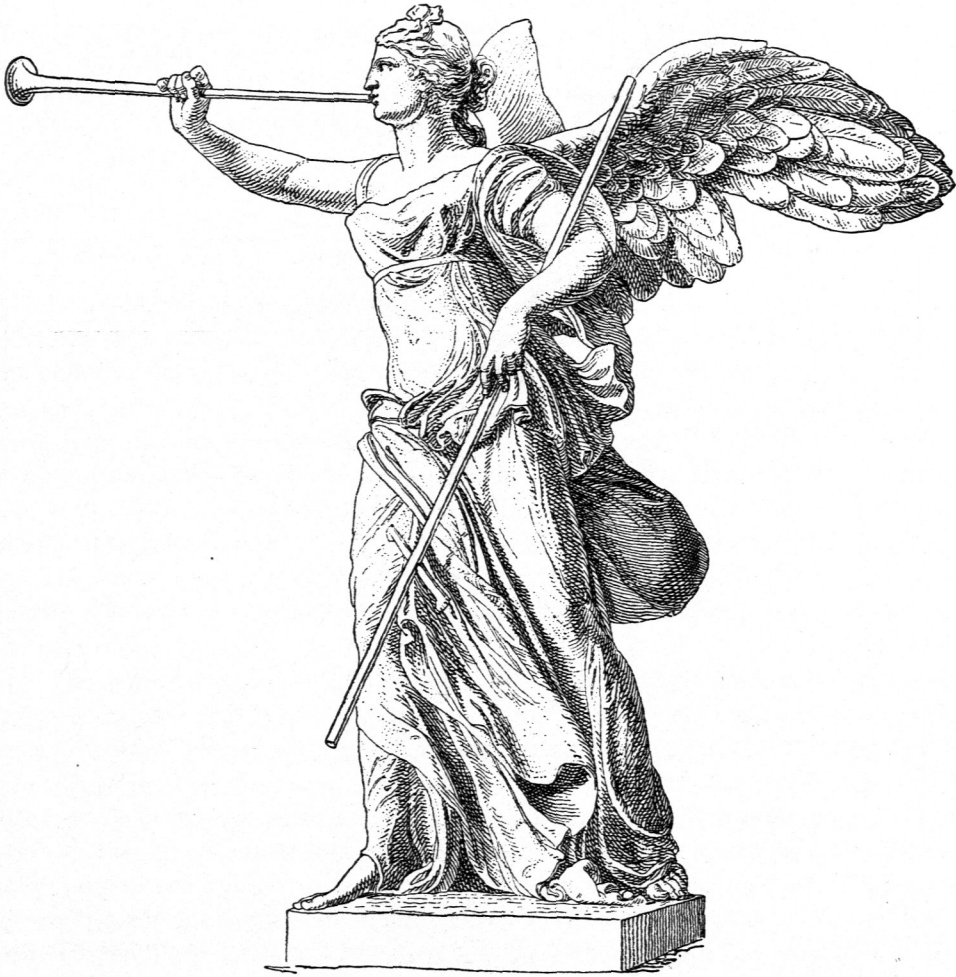
Siegsgöttin von einem Denkmal auf Samothrake; jetzt in Paris.