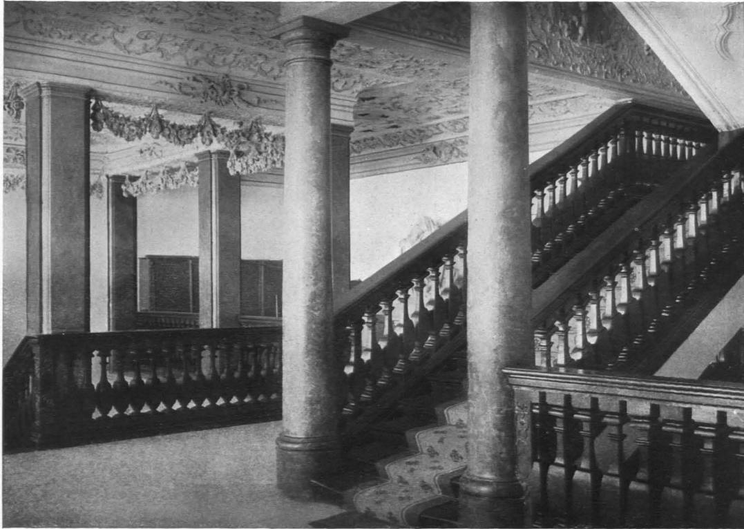
Chur (Kt. Graubünden). — Bischöfl. Schloß auf dem Hof. Treppenhalle des I. Stocks Um 1750