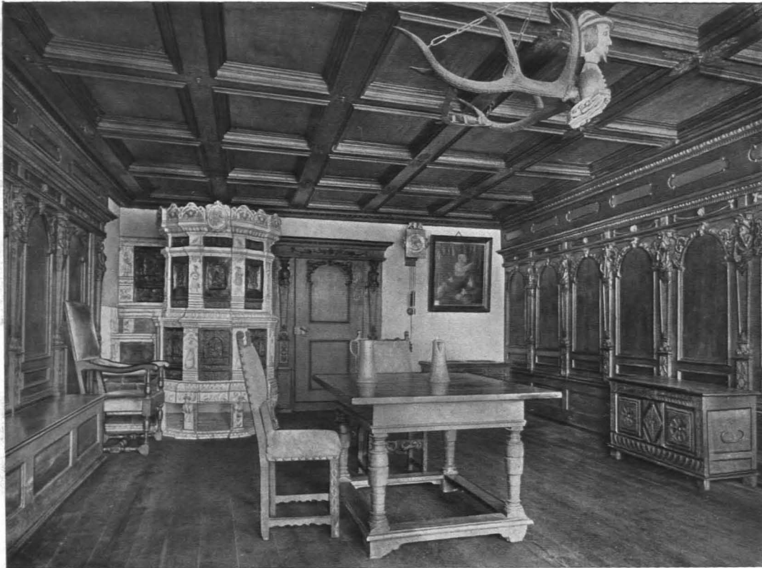
Bern. — Zimmer aus einem Hause in der Kramgasse, von 1645 (Bf. = 8,6 × 5,0 m; H. = 2,65 m) Jetzt im Historischen Museum, Bern