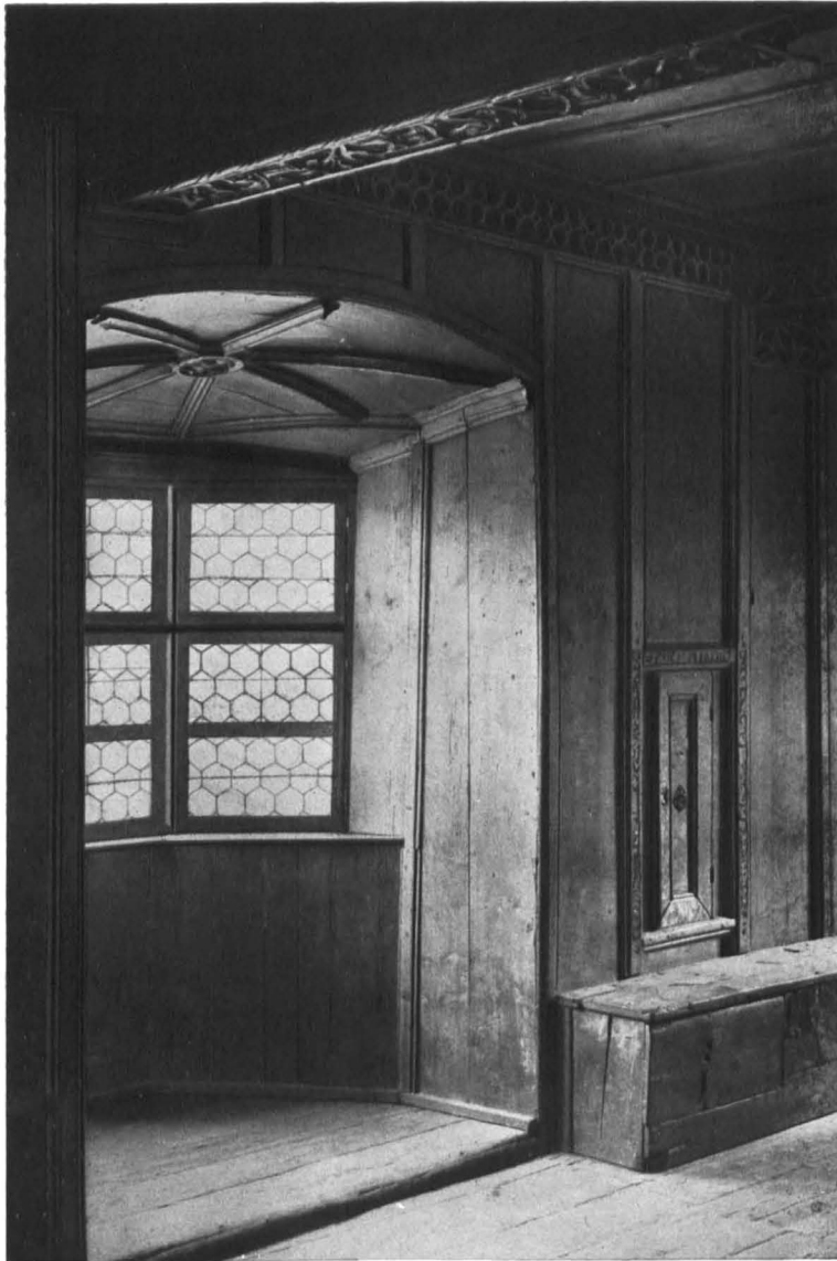
Stube aus dem Ende des 15. Jahrh.

Schloß Reifenstein am Sterzinger Moos (Südtirol)