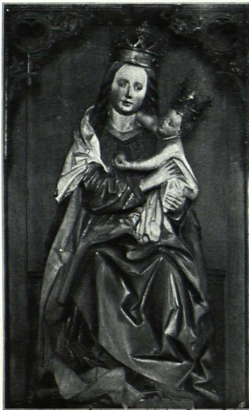
Fig. 259 Mittelfigur vom Altar der Margaretenkapelle (S. 174)

Stäben besetzen Kapitälern der Dienste aufstehen. Im westlichen Joch jederseits ein kurzes, ferner im S. zwei, im N. ein und in den drei Chorschrägen je ein hohes, zweiteiliges Spitzbogenfenster in abgeschrägter Laibung mit verschiedenem Maßwerk. Im W. moderne Empore aus gotischem Marmor in gotisierenden Formen.