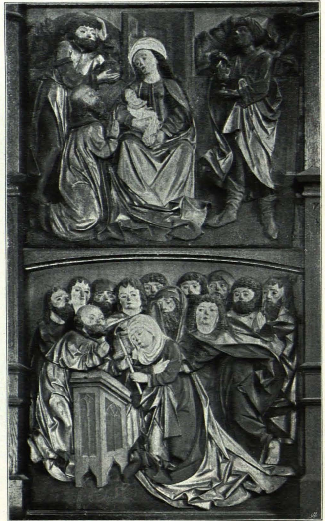
Fig. 260 Rechter Flügel vom Altar der Margaretenkapelle (S. 175)

Die struktiven Teile unverputzt, die untere Hälfte der Wände mit einem Granatapfelmuster in der Art eines gespannten Teppichs bemalt; die Wand darüber graugelb gefärbelt mit einem gezeichneten Rautenmuster, die Gewölbekappen lichtgrau gefärbelt (Taf. XXV). Einheitlicher Raum, der um zwei Stufen erhöhte Chor im Achteck gebrochen. Die Wände sind von jederseits fünf Strebepfeilern gegliedert, denen an der Ostwand zwei weitere entsprechen. Jeder Strebepfeiler besteht aus einem kräftigen Runddienst mit Tellerbasis auf zylindrischem Sockel und aus gekehlten Gewänden, denen ein Rundstab vorgelegt ist und die die Einfassung der spitzbogigen Wandfelder bilden. Reiches Netzgewölbe mit paarweise zusammenstoßenden Dreipässen, dessen birnförmig profilierte Rippen zu viert, beziehungsweise in den Westecken zu dritt, beziehungsweise im Chor paarweise auf den gekehlten, mit