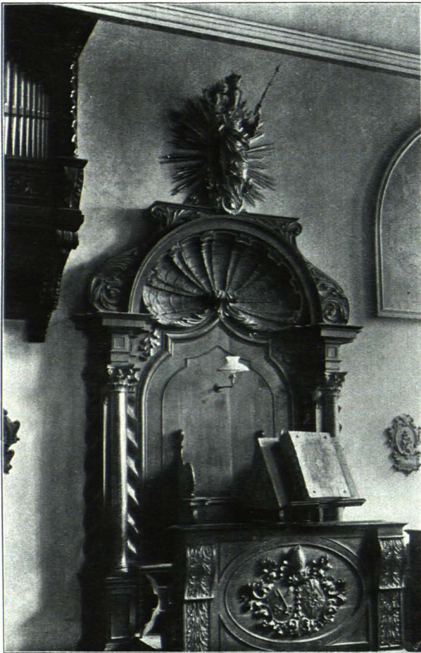
Fig. 198 Abtssitz im Betschor (S. 131)

Psallierchor. (Über dem nördlichen Seitenschiffe.) Unter Abt Placidus 1706 eingerichtet (S. CXXI). Rechteckiger, flachgedeckter Raum mit drei rundbogigen Oratoriumfenstern gegen S. (Langhaus; das mittlere durch Tür zum Teil vermacht), einem ebensolchen breiten im O. (Querschiff), drei hohen Rundbogenfenstern