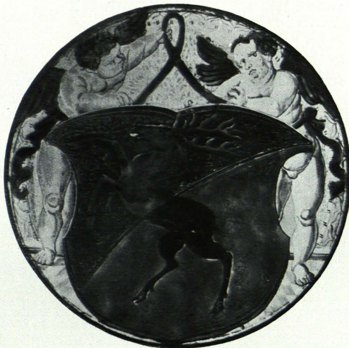
Fig. 194 Glasmalerei, Wappen der Tenn (S. 123)

Rundbogennischen in Blattrankenrahmung und darinnen Figürchen als Repräsentanten der vier Weltteile, in der vorderen ein Putto mit Tiara. Profiliertes Abschlußgesims mit Kyma besetzt. Der Aufsatz unten mit Blattschnur besetzt, darüber die Staffel mit Fruchtgirlanden; der Hauptteil an den abgeschrägten Kanten mit