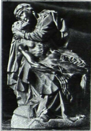
Fig. 175 Pietà, Buchs (S. 116)

dem (Francesco) Trevisani zugeschriebenen Bilde identisch, das der Fürstbischof von Gurk Graf Salm am 21. März 1789 dem Abte Dominikus als Gegengabe für eine kostbare Uhr verehrte (s. S. CLXXXII).