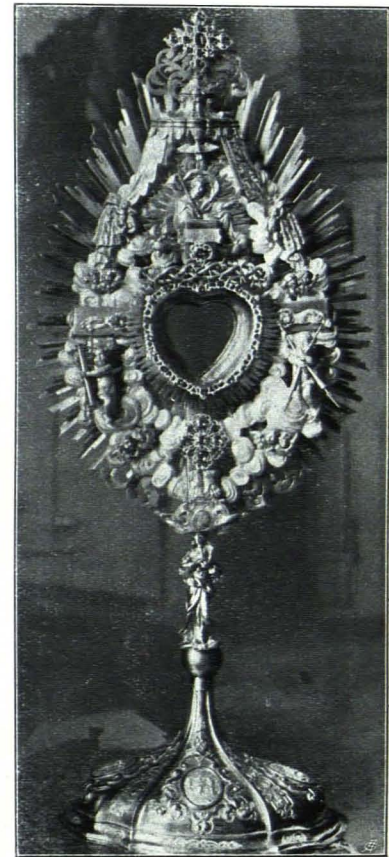
Fig. 68 Monstranz Nr. 4 (S. 43)

Monstranzen 1) : 1. Turmmonstranz, 38 cm hoch. Kupfer, vergoldet (Fig. 65). Sechslappiger Fuß mit Fußplatte und einem mit kleinen Rosetten besetzten Steilrand. Der Fuß verjüngt sich zu einem sechseckigen Schaft über profiliertem Querbande. Darüber gerippter Knauf