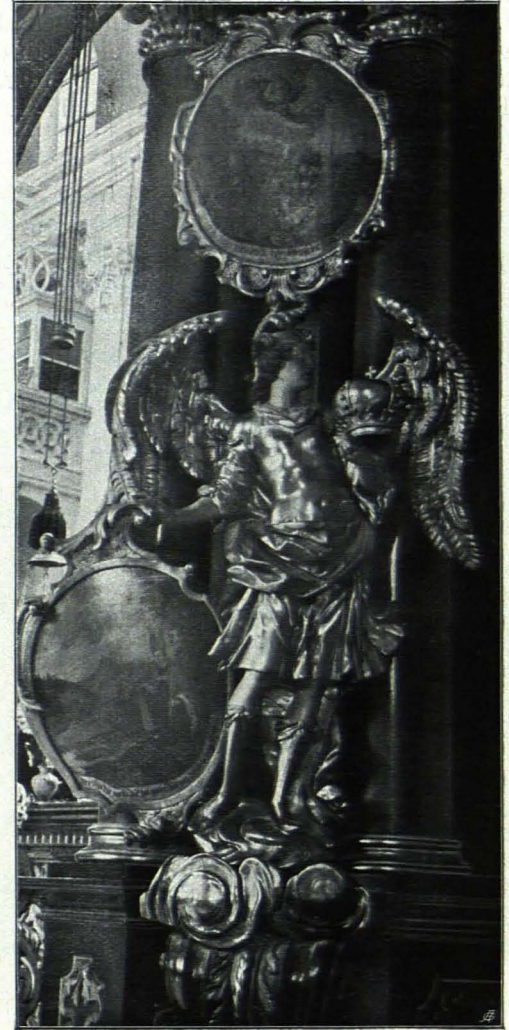
Fig. 49 Stiftskirche, Detail vom Felsengrab des hl. Rupert (S. 27)

Fig. 52. 12. Unter dem sechsten Rundbogen aus rotem und gelblichem Marmor (Fig. 52). Über staffelartigem Sockel wird der verbreiterte Pfeiler des Rundbogens von einer Draperie verkleidet, über der ein dicker, mit Blattornament skulptierter, mit Rosenkränzen behängter Wulst ausspringt. Diesem ist in der Mitte ein kleines Postament mit Inschrift und hängenden Rosenkränzen vorgesetzt, das über reich mit Volutenbändern und Blättern verzierter, in eine Traube auslaufender Konsole aufsteht, die vorne eine kleine Weihwassermuschel trägt. Auf dem Wulste seitlich zwei Putten mit Inschriftsrollen, in der Mitte Aufsatz in Gestalt eines Pyramidenstutzes, mit profilierter Deckplatte über Akanthusfries endend, seitlich von Rosenkränzen begleitet. Auf der Deckplatte Wappenschild in Rosenkranz; vor dem Aufsatz, hinter der Inschriftsplatte zwei Putten, der eine ein Reliefbild eines Totenkopfes weisend, der andere einen Totenkopf in der Hand haltend. Dominus Joann. Lib. B. a Plaz D. in Thurn & Gradisch 1666. Moesti haeredes hoc monumentum P. P.