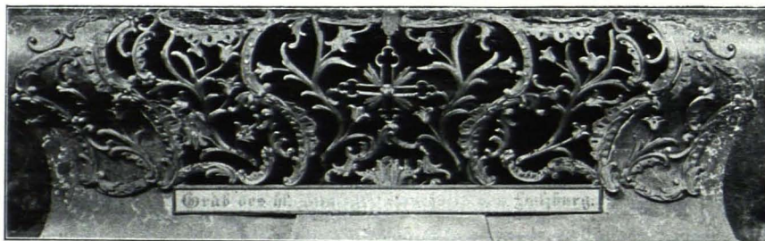
Fig. 36 Stiftskirche, Mensagitter vom Altar Nr. 3 (S. 17)